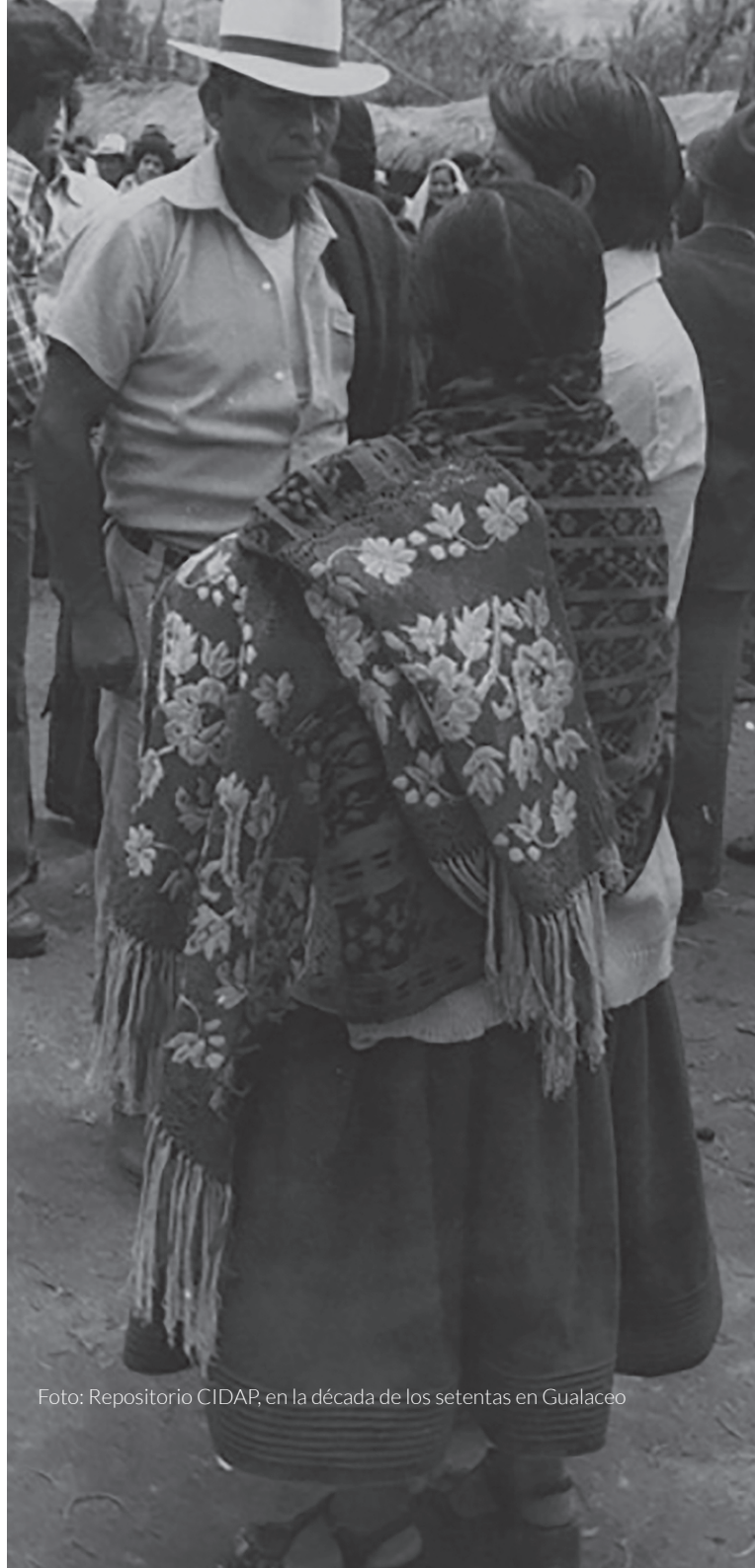
en la década de los setentas en Gualaceo

Instituto Nacional de Patrimonio Cultural. (2015). Plan de Salvaguardia de la Técnica Tradicional de la Elaboración de los Paños o Macanas de Gualaceo (IKAT) .